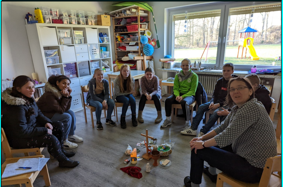
„Ich lebe und ihr sollt auch leben“ - Töpfern, Ostergarten, die Ostergeschichte erleben