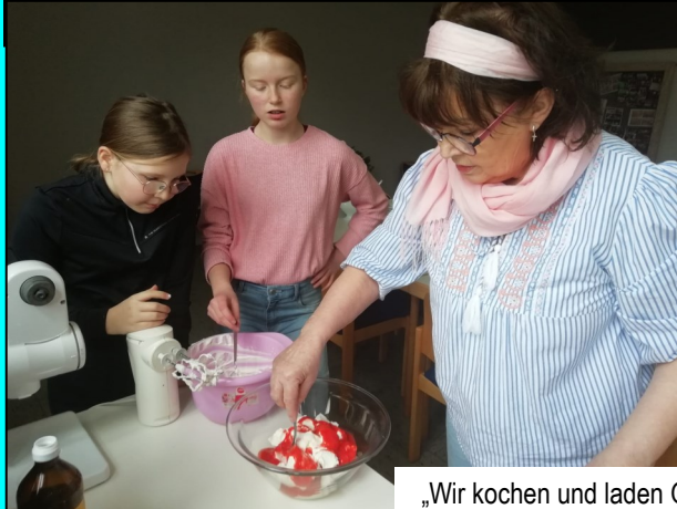
„Wir kochen und laden Gäste ein“