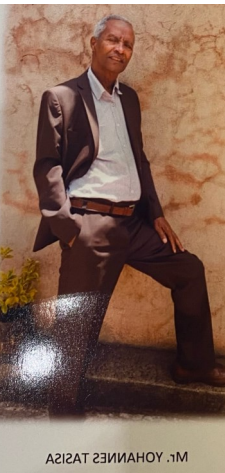
AI2IAT 23IINAHOY .1M

Mittlerweile steht der Termin auch schon fest. Die Reisegruppe besteht aus 6 Personen und wird vom 01.06. bis zum 15.06. Gast in unseren Kirchengemeinden sein.